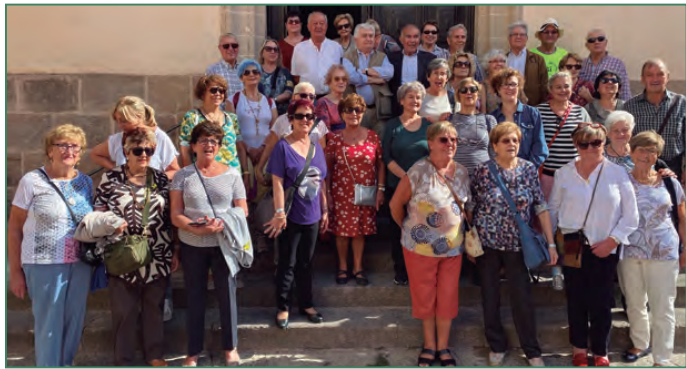
Els membres de la Coral Camprodon davant la catedral