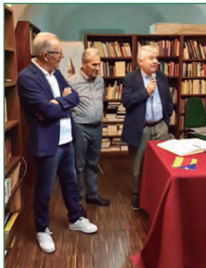
L'autor a la seu de l'Obra Cultural de l'Alguer, amb el president d'aquesta i el president de la Coral