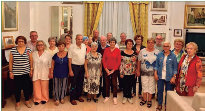
Amb el director de l'Escola d'Alguerés, a qui van dedicar un parell de cançons homenatjant-lo