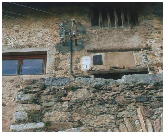
CASA DE LA CAMPA

A la casa de la Campa encara hi ha una placa que diu "Cuartel".