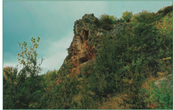
Roques Blanques, sobre el veïnat d'Abella, on els carlins estimbaven daltabaix als lliberals de viu en viu

A casa nostra tenim un cas semblant: a Roques Blanques, sobre el veïnat d'Abella, a més d'afusellar-los els estimbaven daltabaix.